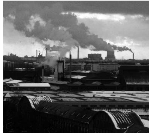
Industriegelände der ehemaligen Deutschen Waffen- und Munitionswerke im Berliner Bezirk Reinickendorf

Das Landesarchiv Berlin konnte nach dem Archivgesetz von 1993 auch das Schriftgut nichtstaatlicher Stellen übernehmen, soweit es im öffentlichen Interesse lag. Die IHK hatte in den 90er Jahren ihre